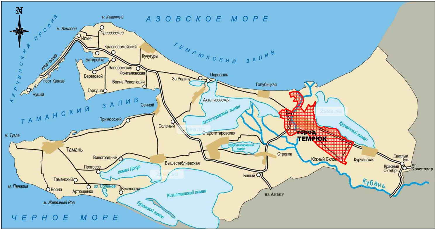
Схема размещения г. Темрюка в структуре Темрюкского района. М 1:500 000